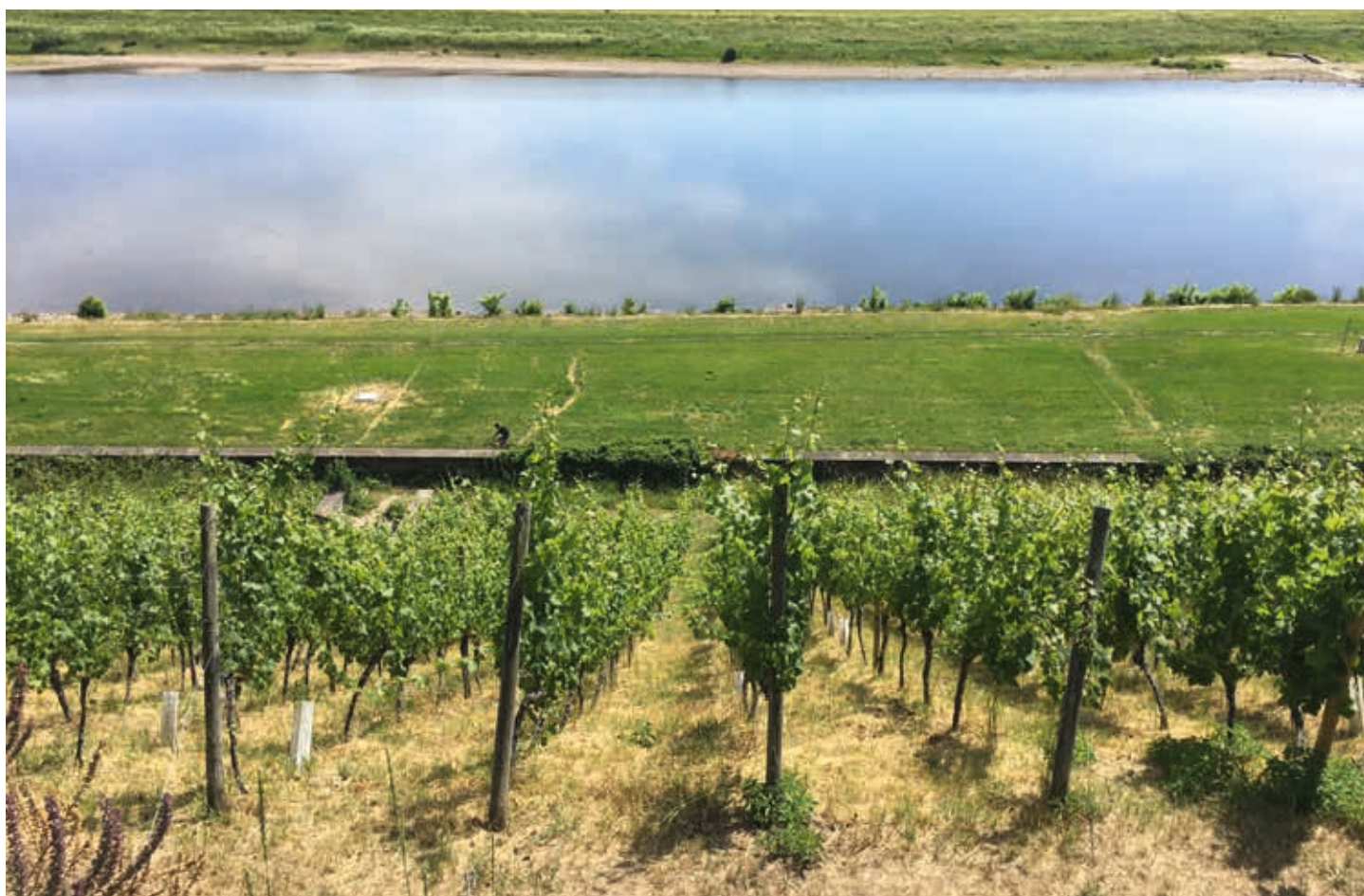
Vingård vid Elbbang