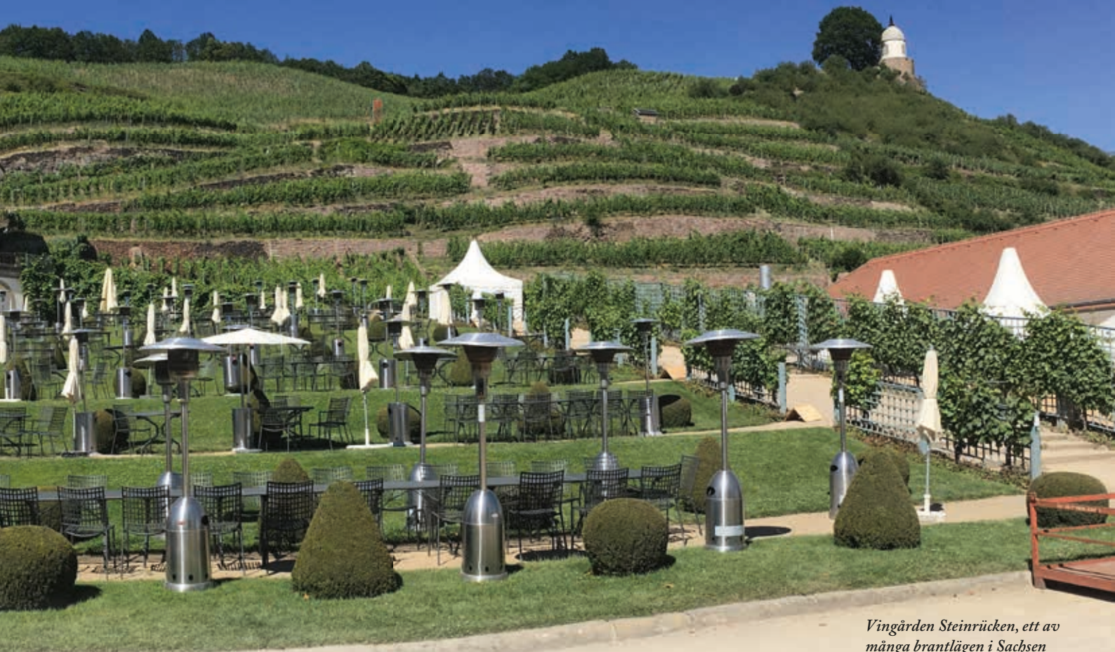
Vingården Steinrücken, ett av många brantlägen i Sachsen

(sockerhalt) vid skörd. Vid en närmare genomgång av de moderna årgångarna i Sachsen kan man ana klimatförändringen och stigande medeltemperaturer när man ser på hur bra de senaste 10 åren varit jämfört med de 10 föregående. 2018, ett år som var för varmt i många tyska regioner, räknas som extremt bra, ett av Sachsens bästa genom tiderna. 2015, 16, 17 och 19 är samtliga bra årgångar. Vill man prova äldre viner är 2006 ett bra val och 2000 skall undvikas.