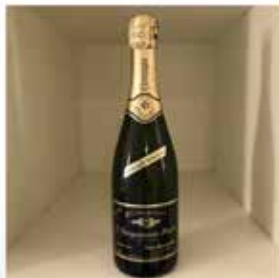
Bergeronseu-Maion Grande Reserve